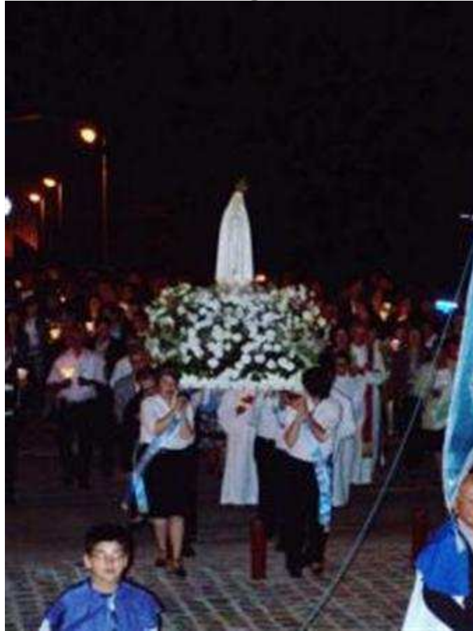
2/2 - Lors de la procession la communauté portugaise à rendu hommage à Notre Dame de Fatima.